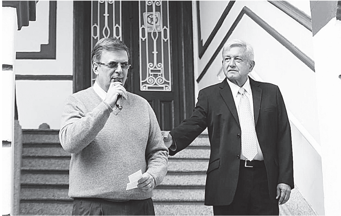
EL EQUIPO DE LÓPEZ OBRADOR aseguró que la reunión será un primer acercamiento con el gobierno de EU.

“Es una delegación del más alto nivel, lo cual es un buen síntoma después de la conversación del presidente electo con Donald Trump”, indicó Ebrard.