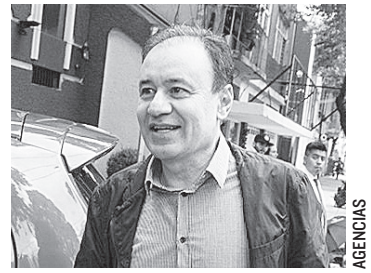
EL PRÓXIMO SECRETARIO DE Seguridad Pública dijo que crearán un programa de capacitación y profesionalización de policías municipales.

Añadió que el combate a la corrupción también será uno de los puntos importantes para mejorar los niveles de seguridad “porque no hay crimen organizado, o desorganizado, que no avance de la mano de la protección oficial”, señaló.