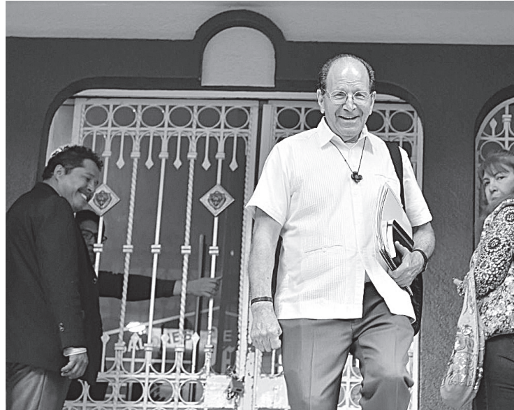
SOLALINDE AFIRMÓ que López Obrador será un presidente amigo, que de verdad está con su pueblo y con los pobres.

Asimismo, dijo que el político tabasqueño será un presidente “amigo, que de verdad está con su pueblo y con los pobres”.