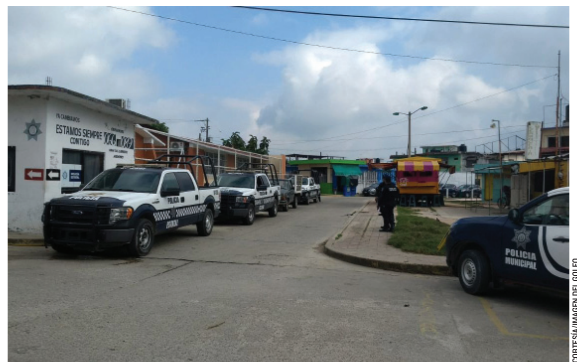
NO HAY HASTA EL MOMENTO UN OPERATIVO de fuerzas policiales en las colonias de Las Choapas, corren mensajes falsos por Internet.

En próximos días, también adelantó que podrían haber cambios de la alianza de unidad que está conformada por cinco candidatos a la agencia municipal de Villa Allende.