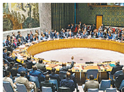
EL ORGANISMO RECHAZÓ la resolución con ocho votos en contra, tres a favor y cuatro abstenciones.

Macron mantuvo dos conversaciones telefónicas con el presidente estadounidense, Donald Trump, y la primera ministra de Reino Unido, Theresa May. “Saludó la excelente coordinación de nuestras fuerzas