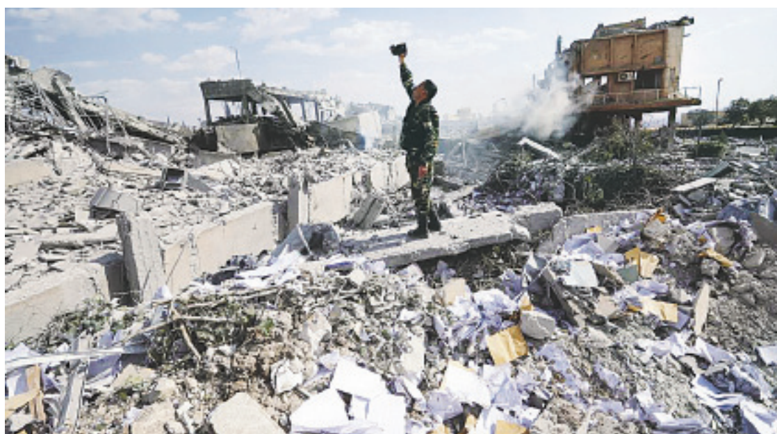
NIKKI HALEY ASEGURÓ QUE SI EL RÉGIMEN sirio usa sus gases venenosos nuevamente, EU está cargado y engatillado.

“Estados Unidos está preparado para actuar de nuevo para asegurar que Siria entienda que habrá un precio que pagar si vuelven a usar armas químicas”, dijo Pence.