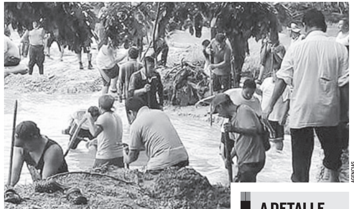
EL DESCENSO EN EL VOLUMEN de las corrientes ha quitado atractivo al sitio.

Fuentes de Protección Civil indicaron que en las labores participan un centenar de habitantes del Ejido Agua Azul, quienes con palas, picos y otras herramientas realizan labores de limpieza y desazolve con la intención de devolver el cauce a las cascadas.