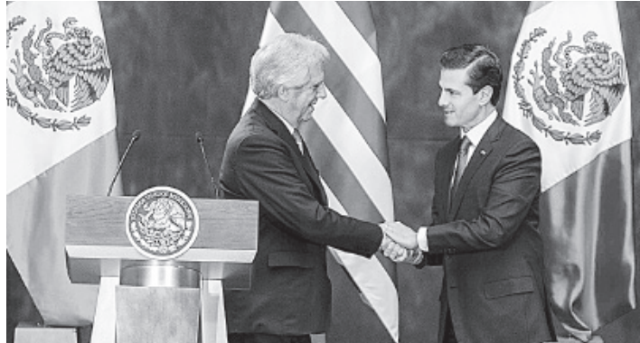
URUGUAY ES EL ÚNICO INTEGRANTE del Mercosur con el que México tiene un acuerdo de libre mercado.

“Tenemos la voluntad política más firme de continuar trabajando juntos para potenciar aún más los instrumentos bilaterales vigentes y de la negociación”, agregó.